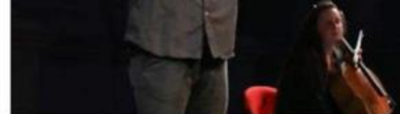
L'attore è stato l'ultimo ad andare in scena prima della chiusura FDP

legame quasi indissolubile. Solo per restare all'estate appena trascorsa, nel corso della quale è stato possibile godere di un piccolo spiraglio di luce "artistica" nella tenebra che ci avvolgeva e tuttora ci avvolge, il prolifico attore pa-